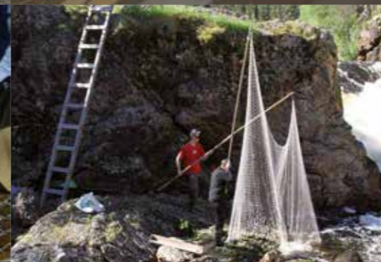
Перемещение через порог Киутакёнгяс