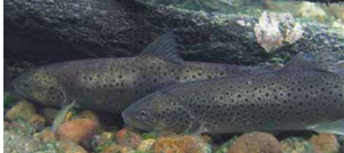
КУМЖА ОТДЫХАЕТ ВО ВРЕМЯ МИГРАЦИИ

Кумжа живет в озерах много лет, прежде чем становится достаточно большой (от 2 до 4 кг, более 60 см), чтобы отправиться в первый поход на нерест в реки, где она родилась. И такой путь рыба проделывает много раз, если только не попадет на крючок рыбака или в сеть.