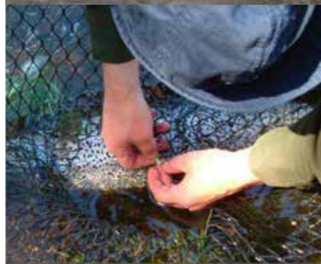
Рыбак смотрит номер Carlin-метки