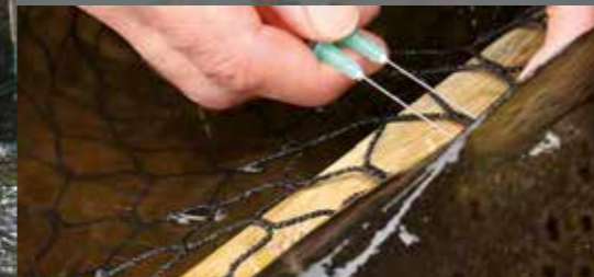
Установка Carlin-метки на спинной плавник