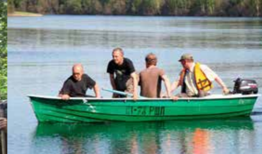
Ученые в одной лодке